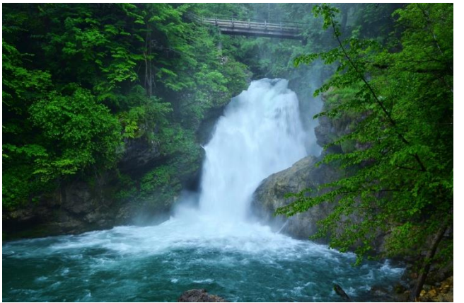
Dolina Voje i Mostnica